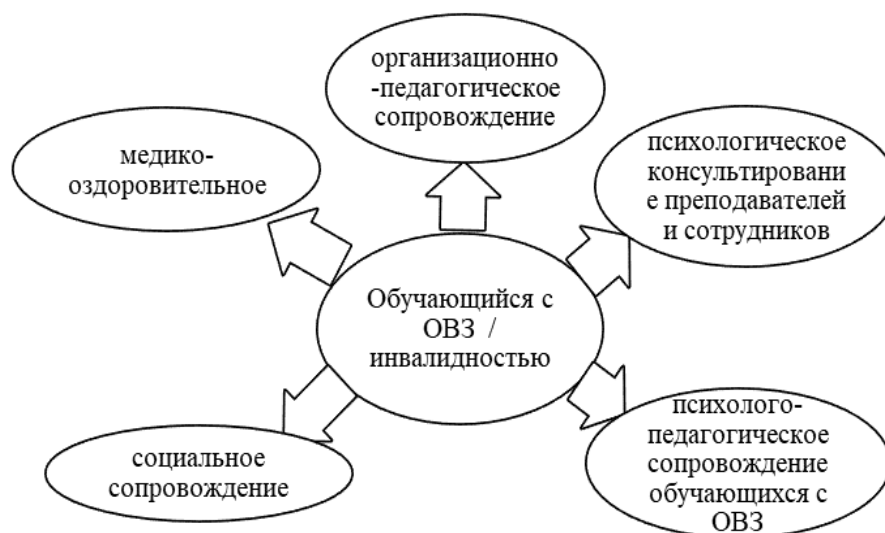
Рисунок 1 – Структура векторов комплексного сопровождения образовательного процесса лиц с ОВЗ и инвалидностью

Такое сопровождение включает в себя: организационно-педагогическое сопровождение, психологическое консультирование преподавателей и сотрудников по психофизическим особенностям лиц с ОВЗ и инвалидов, психолого-педагогическое сопровождение таких обучающихся, социальное сопровождение и медико-оздоровительное.