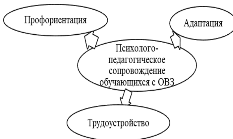
Рисунок 2 – Структура векторного психолого-педагогического сопровождения лиц с ОВЗ и инвалидностью

Психолого-педагогическое сопровождение, так же как и консультирование преподавателей, сотрудников по работе с обучающимися с ОВЗ и инвалидностью осуществляет педагог-психолог. Такая работа направлена на изучение, развитие и коррекцию личности обучающихся, их профессиональное становление и психопрофилактику индивидуальных стратегий поведения, оказание помощи в устранении трудностей в общении, социальной адаптации и обучения (Рисунок 2).